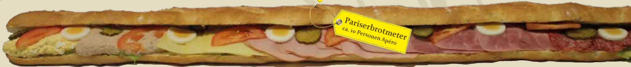
Pariserbrotmeter ca. 10 Personen Apéro