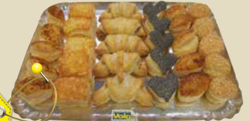
Blätterteigkonfekt kleine Platte ca. 6 Personen