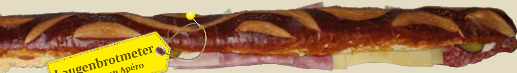
Laugenbrotmeter ca. 10 Personen Apéro