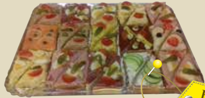
Belegte Brötli grosse Platte z.B. halbiert, 30 Stk.