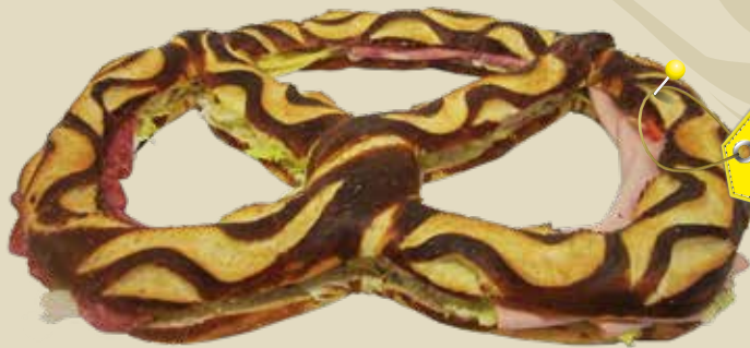
Brezel gross, ca. 10 Personen klein, ca. 8 Personen

Schildkröte Füllung nach Wahl: Salami, Schinken, Fleischkäse, Käse, Lachs, Bündnerfleisch, Weichkäse