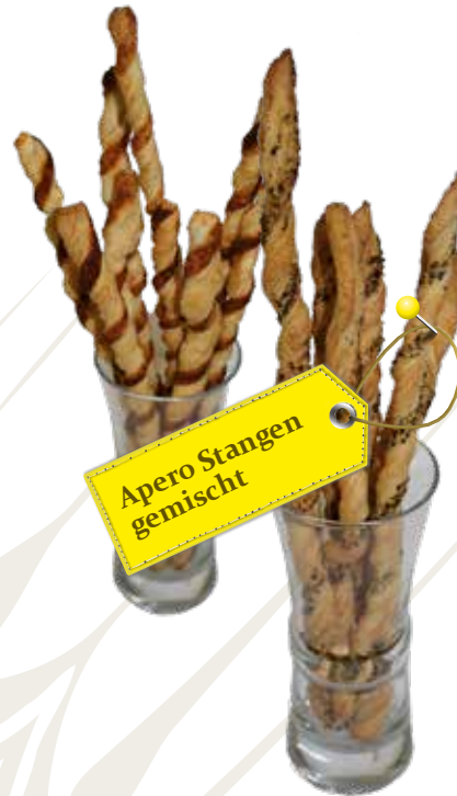
Apero Stangen gemischt