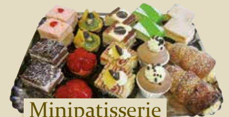
Minipatisserie kleine Platte, 20 Stk.