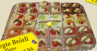
Belegte Brötli kleine Platte z.B. geviertelt, 36 Stk.