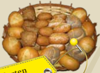
versch. Sorten Spezialbrötli (auch Mini)