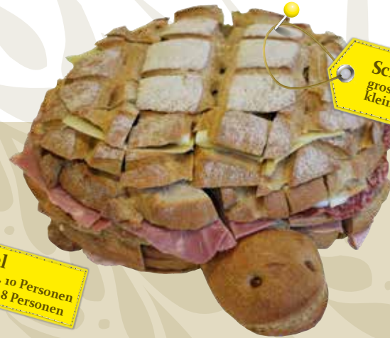
Schildkröte gross, ca. 10 Personen klein, ca. 6 Personen

Meterbrote und Brezel Füllung nach Wahl: Salami, Schinken, Fleischkäse, Thon, Ei, Käse, Lachs, Bündnerfleisch, Weichkäse