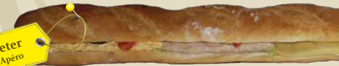
Ruchbrotmeter ca. 10 Personen Apéro