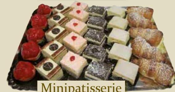
Minipatisserie grosse Platte, 30 Stk.