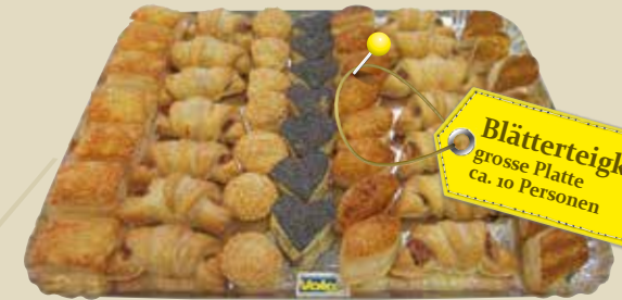
Blätterteigkonfekt grosse Platte ca. 10 Personen